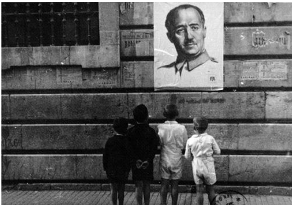
Niños mirando un cartel con el retrato de Franco ( Noticiero de España , Núm. 5, 2 de octubre de 1937)

Muchas de las imágenes recogidas en este apéndice pueden ser conocidas, sin embargo, son importantes debido a su originalidad, a su calidad y a la difusión posterior que algunas de ellas tuvieron en otros canales comunicativos. El Noticiero de España posee alrededor de 5000 fotografías de las cuales sólo se recoge una pequeña selección acorde al contenido que se desarrolla en el Dossier 1 .