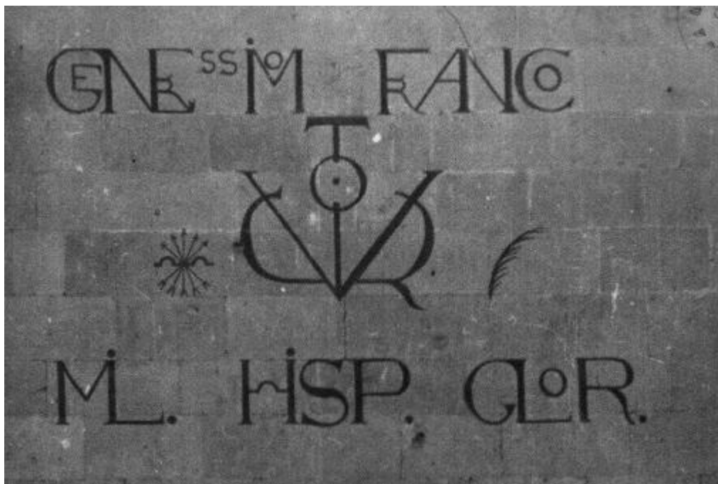
Víctor Académico ( Noticiero de España , Núm. 5, 2 de octubre de 1937)