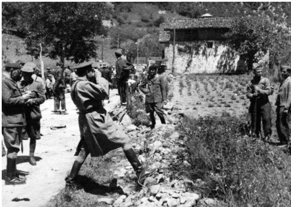
El General Mola fotografía a unos soldados en el frente de Vizcaya ( Noticiero de España , Núm. 9, 30 de octubre de 1937)