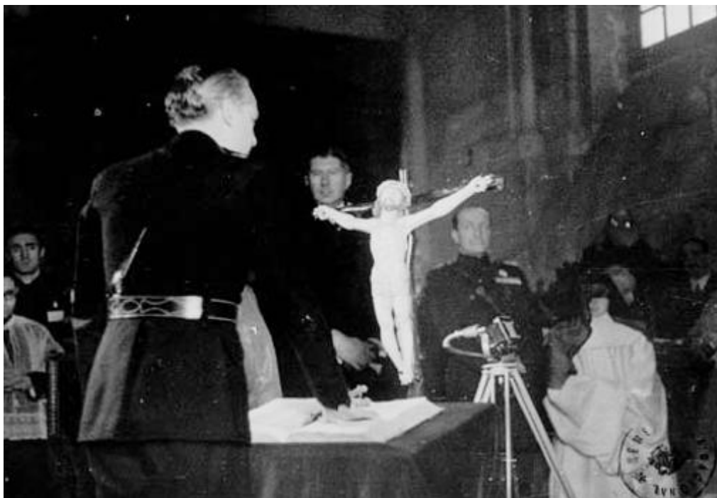
Ramón Serrano Suñer en su jura como consejero de FET de las JONS el 2 de diciembre de 1937.