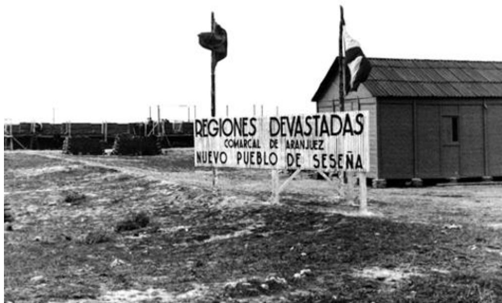
Obras de reconstrucción de casas en Seseña (Toledo). ( Noticiero de España , Núm. 182, 29 de marzo de 1941)