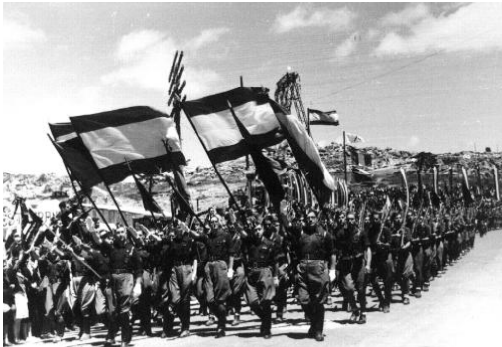
Desfile de la Octava bandera militar de Castilla que fue condecorada en el Alto de los Leones ( Noticiero de España , Núm. 96, 22 de julio de 1939)