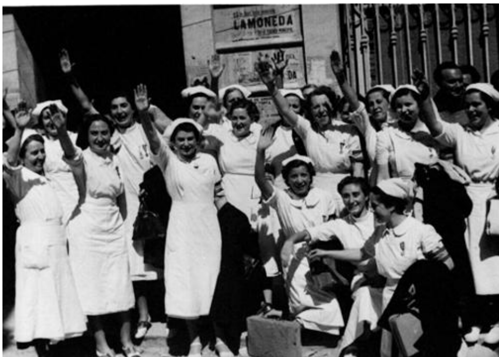
Mujeres trabajando para la Beneficencia del Estado en Castellón el 15 de junio de 1938

( Noticiero de España , Núm. 39, 18 de junio de 1938)