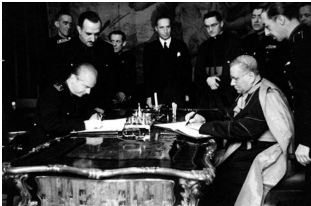
Firma del acuerdo entre España y la Santa Sede en el Ministerio de Asuntos Exteriores ( Noticiero de España , Núm. 193, 21 de junio de 1941)