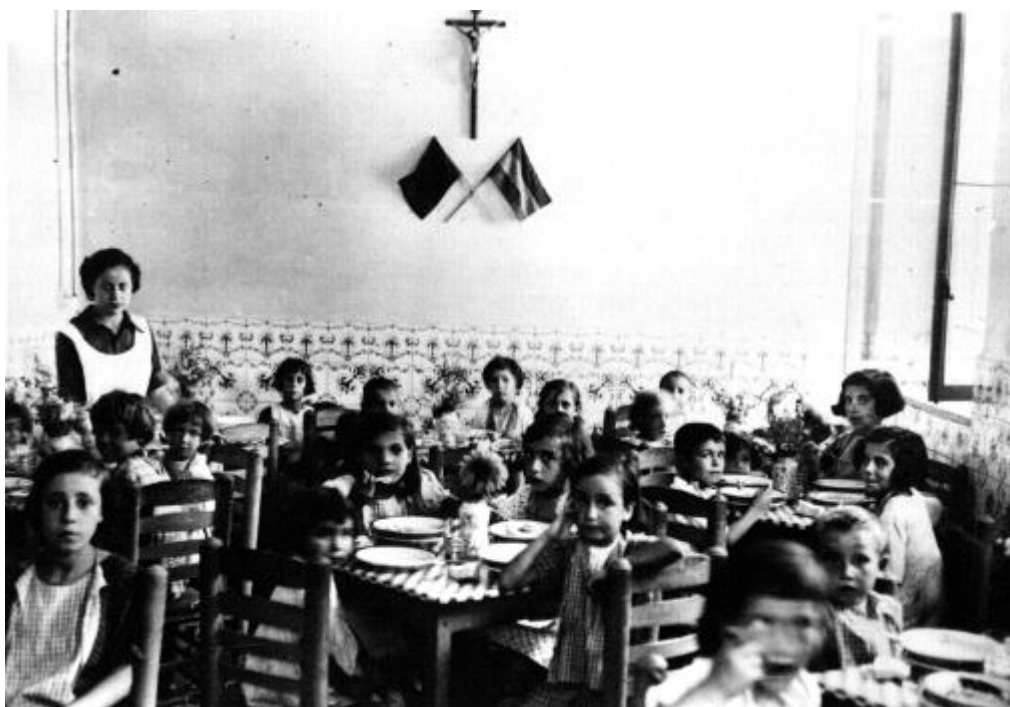
Niños en el comedor de la calle Sevilla (Málaga) ( Noticiero de España , Núm. 1, 4 de septiembre de 1937)