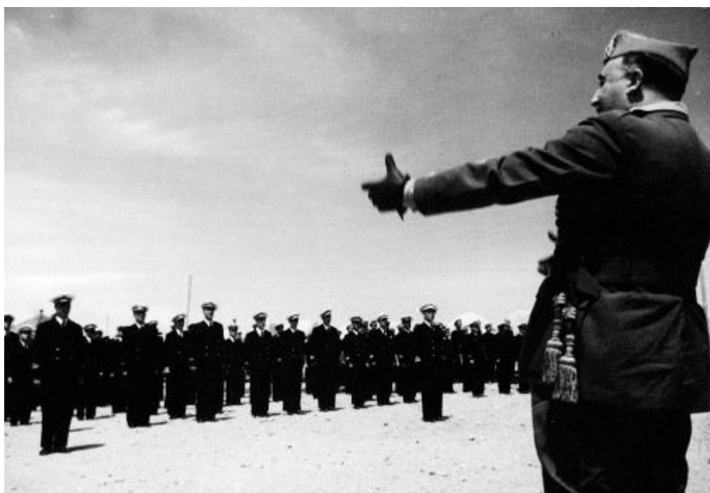
Franco arengando a los marinos en Vinaroz el 31 de mayo de 1937 ( Noticiero de España , Núm. 37, 4 de junio de 1938)