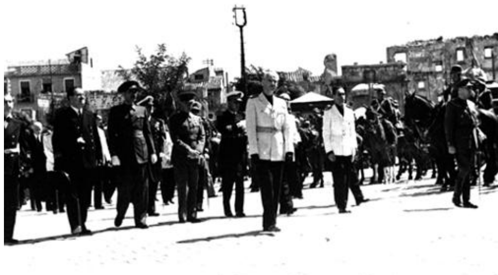
Entierro del Cardenal Primado de España en Toledo ( Noticiero de España , Núm. 51, 24 de agosto de 1941)