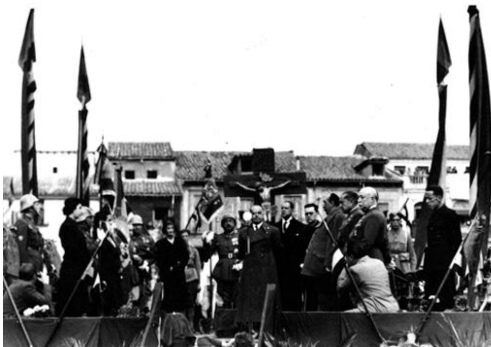
Entrega de una bandera y dos estandartes a la Guarnición de Alcalá de Henares ( Noticiero de España , Núm. 130, 30 de marzo de 1940)