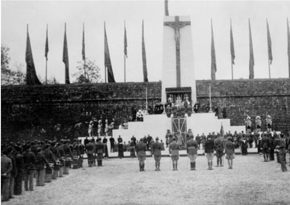
Misa de campaña en Pamplona ( Noticiero de España , Núm. 11, 13 de noviembre de 1937)