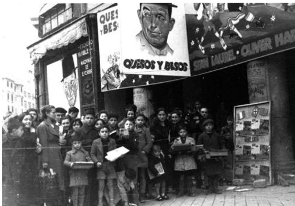
Reparto de juguetes a los hijos de periodistas y personal de periódicos madrileños realiza- do por la Asociación de la Prensa ( Noticiero de España , Núm. 119, 13 de enero de 1940)