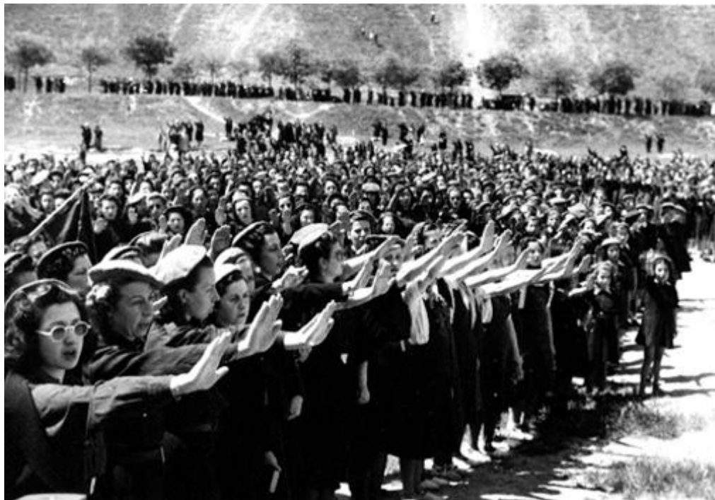
Mujeres de la Sección Femenina de la Falange en la Pradera de San Isidro, durante la celebración de una misa ( Noticiero de España , Núm. 189, 17 de mayo de 1941)