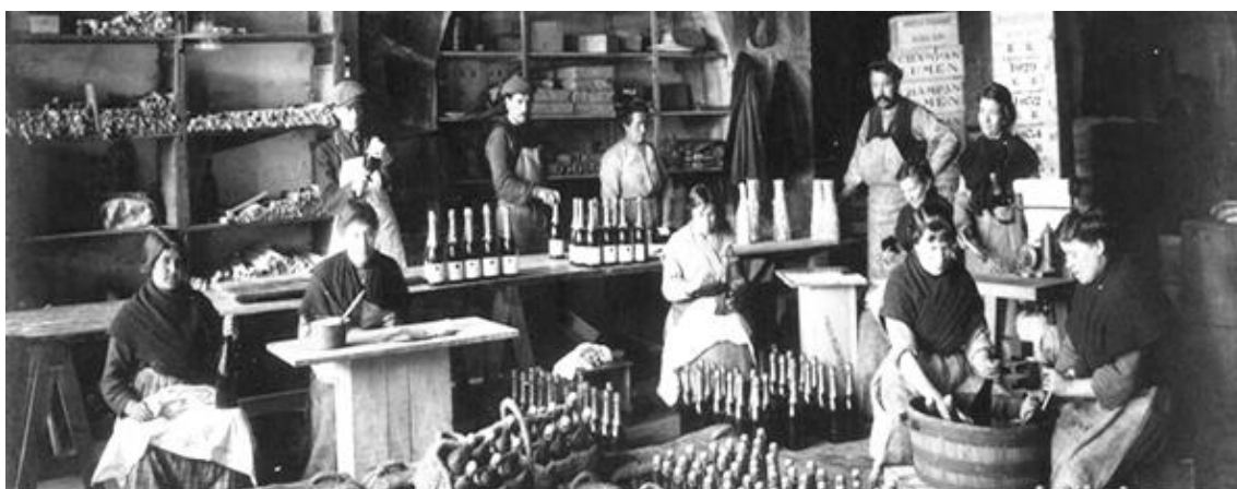
Fig. 8. Puesta de etiquetas, cápsulas y encajonado del champán Lumen. La Ilustración Española y Americana , 15 septiembre 1918, p.9.

económica. Este crecimiento es lento y poco espectacular, pero es real y continuo, y modifica las estructuras económicas y sociales» 83 . El desarrollo económico de estos años no fue igual para todos los sectores. El viñedo y sus productos derivados sufrieron un retroceso generalizado, pues se recuperaron las cosechas francesas, que redujeron las exportaciones españolas en más de tres millones de hectólitros, y aumentaron la producción (un 30% más), por la expansión de la superficie cultivada y el incremento de los rendimientos por hectárea. Todo ello produjo grandes protestas, mítines y reclamaciones al gobierno de los viticultores que pedían la prohibición del alcohol industrial para usos de boca y la exclusividad para los alcoholes vínicos. El Real Consejo de Sanidad publicó un informe donde expresaba la perfecta compatibilidad entre los alcoholes industriales y su uso para la fabricación de licores, lo que produjo un enorme rechazo de los productores vitivinícolas. En 1924, el gobierno aprobó una Ley de Alcoholes, que