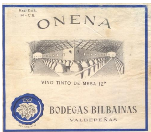
Fig. 6. Etiqueta del vino Onena de las Bodegas Bilbainas. Valdepeñas.