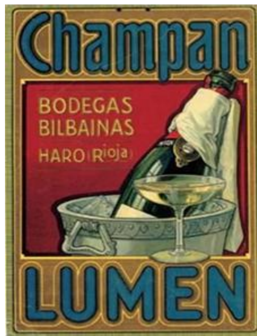
Fig. 7. Cartel publicitario del Champán Lumen de las Bodegas Bilbaínas. Años 20.

Desde la creación de las primeras marcas, a comienzos del siglo (Noé, Eterra etc.), las Bodegas Bilbaínas habían ido aumentando el número de marbetes para los nuevos productos que elaboraban. En 1909 comenzaron a producir ron con la denominación Old Nick Rum ; en 1911 coñac Faro; en 1912 coñac Pipiolo y vino Brillante; en 1914 vino la marca viña Pomal (inicialmente la solicitud era El Pomal) y coñac y vinos con las marcas Apollo, Venus y El Cid; en el mismo año vino y vermut Onena; en 1915 coñac marca Imperial y Optimus y en 1916 champán Lumen. Este último lo elaboraba en todas sus variedades: extraseco, seco, medio seco, dulce y brut.