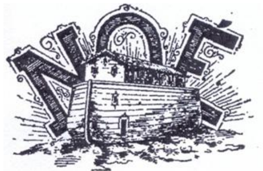
Fig. 3. Primera marca de vino y aceite solicitada por las Bodegas Bilbaínas. Boletín de la propiedad intelectual e industrial , 27 septiembre 1901, p. 653. Oficina Española de Patentes y Marcas.