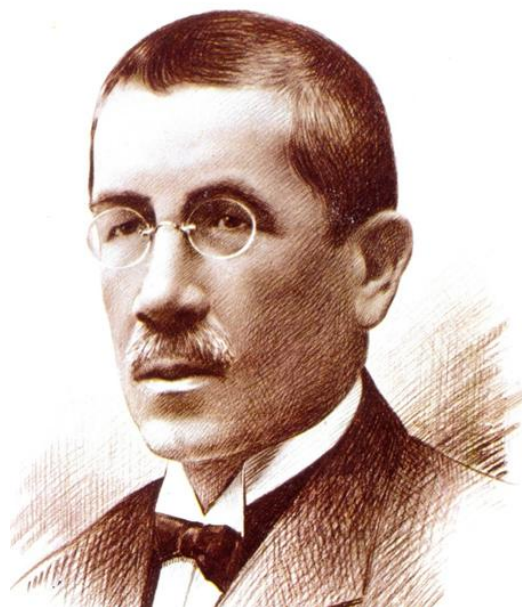
Fig. 1. Retrato de Santiago Ugarte Aurrecoechea

la apertura del vino español a otros mercados, la fabricación de aguardientes que sustituyeran los de importación (Suecia y Alemania) y el aumento de la propaganda para captar nuevos clientes 5 .